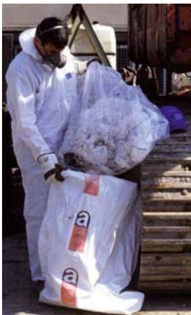
Les opérations de désamiantage nécessitent des protections adéquates.